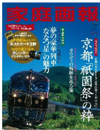
▲『家庭画報 7月号 特装限定版』 (定価 1,550 円・税込)