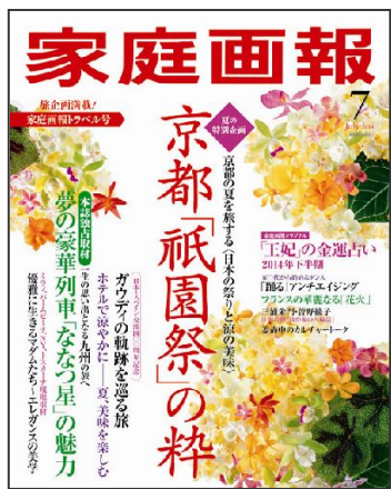
▲『家庭画報 7月号』 (定価 1,200 円・税込)